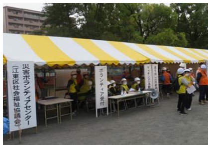
社会福祉協議会災害ボランティアセンター