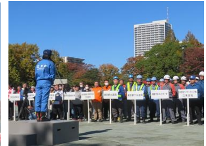
区長講評・お礼の言葉