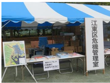
江東区危機管理センター