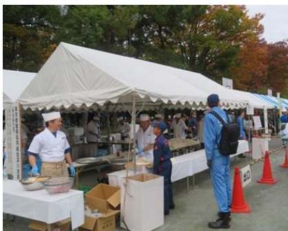
防災炊き出し体験