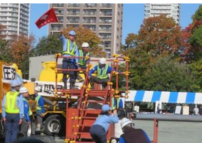
下水道管応急復旧訓練