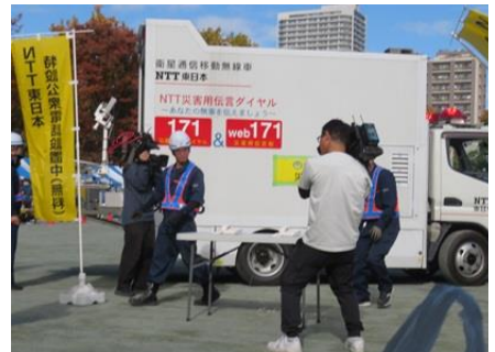
災害用特設電話設置