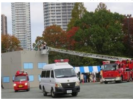
被災ビル屋上から被災者救出訓練