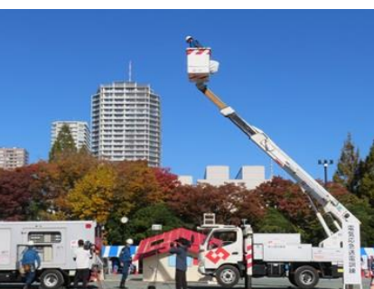
電気応急送電訓練