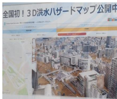
荒川下流 3D 洪水ハザードマップ