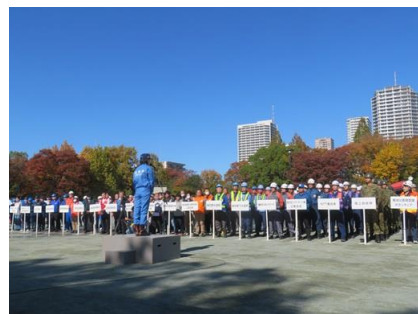
多数の防災訓練参加団体

所感 ：東日本大震災、熊本地震、関東震災 101 年、元旦の能登半島地震、夏の能登半島豪雨洪水が続く 災害列島日本 。30 年 70%の首都直下型地震を想定した令和 6 年の江東区防災訓練に参加した。倒壊建物の被災者救出が続き、ガス管復旧訓練、災害用特設電話設置、電気応急送電復旧訓練、下水道管応急復旧訓練と続き、最後に倒壊家屋から出火し、大煙に驚かされた。消防放水で、訓練が終了、最後に区長からの講評とお礼の挨拶で終了した。