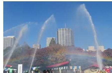
鎮火放水で虹が発生