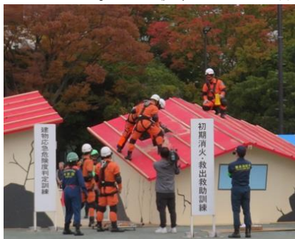
倒壊家屋の被災捜索