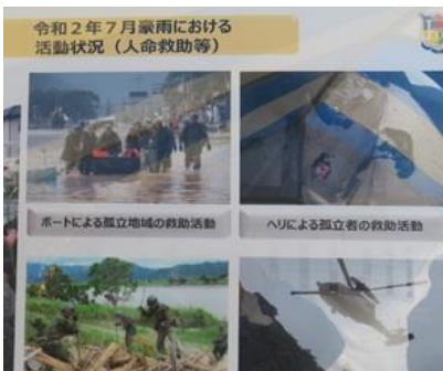
防衛省・自衛隊人命救助等