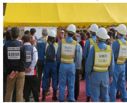
トリアージ・医療訓練