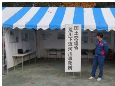
国土交通省荒川下流河川事務所