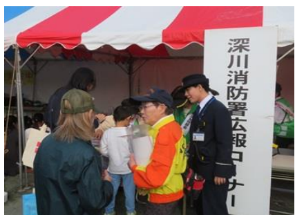
深川消防署広報コーナー