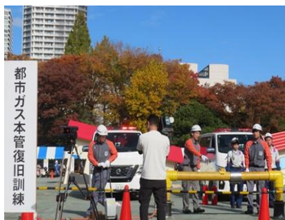
都市ガス本管復旧訓練