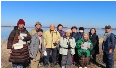
北印旛沼を背景に