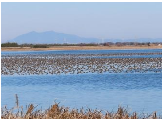
筑波山を背景にトモエガモの群集