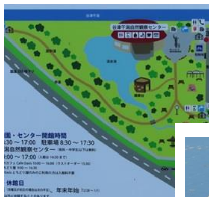
谷津干潟公園マップ