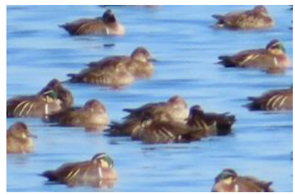
トモエガモの雄と雌