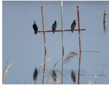
カワウがのんびり