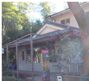
史跡の駅おたカフェ