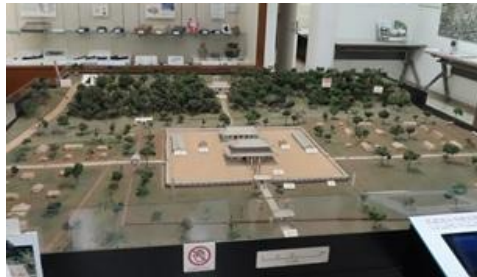
武蔵国分寺推定復元模型