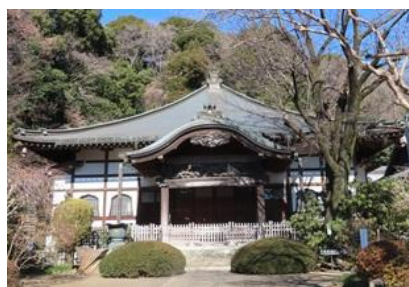
現在の武蔵国分寺